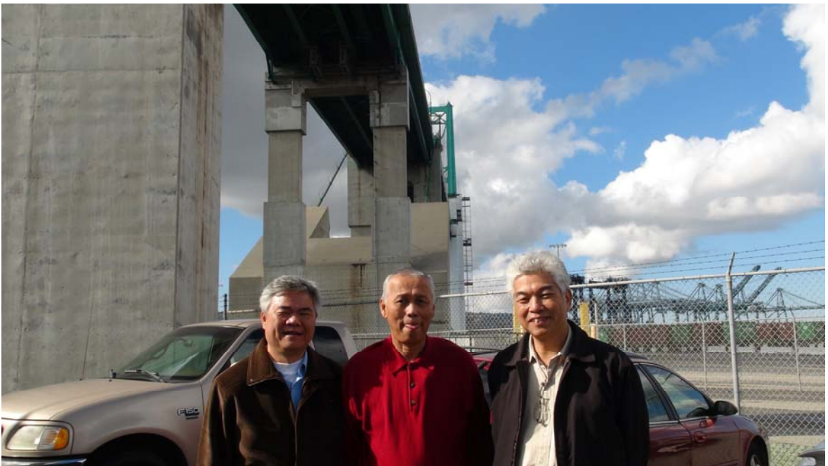
洛杉磯觀摩 Vincent Thomas Bridge 鋼構橋梁檢測作業