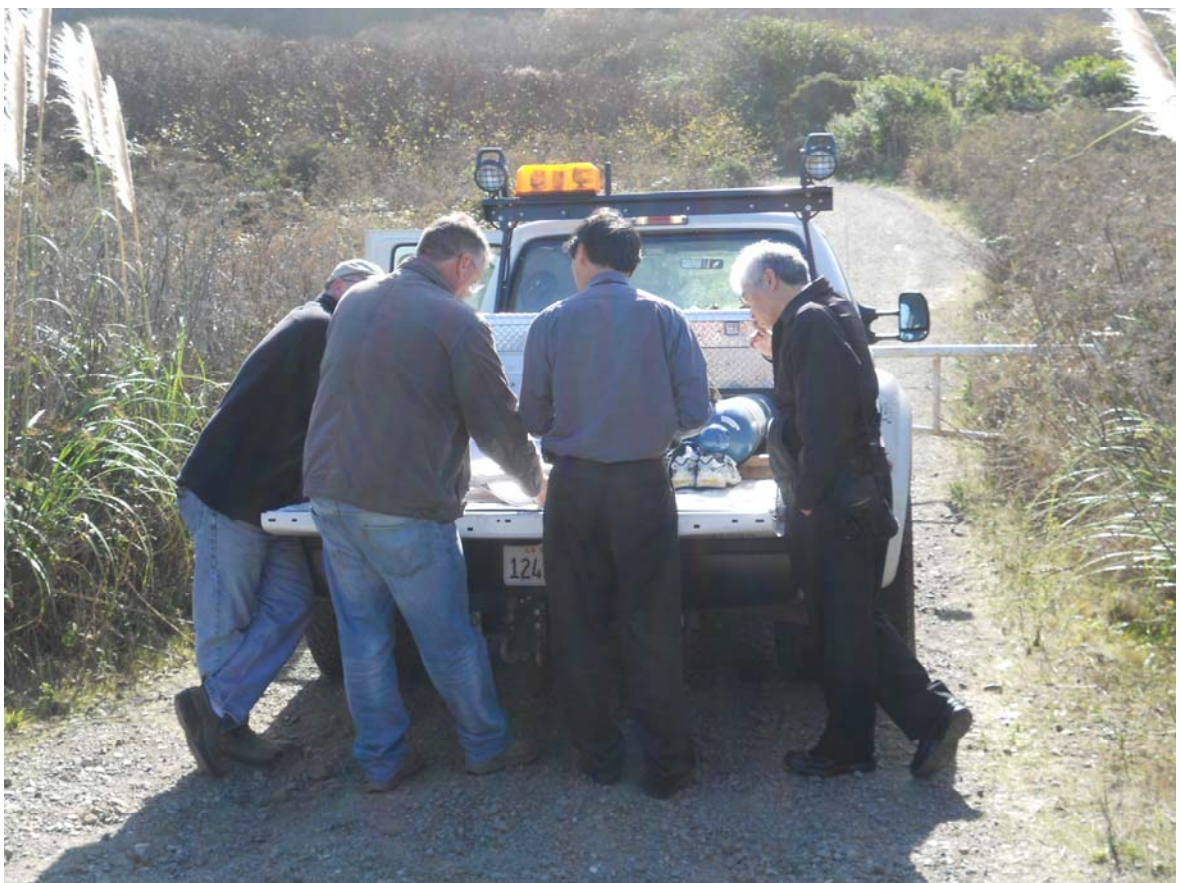
水下檢測小組於 Gualala River Bridge 作業討論情形