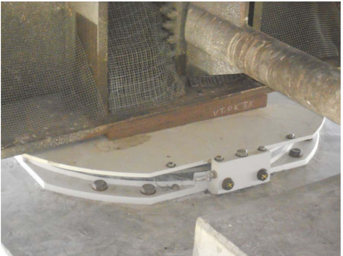
Antoich Bridge 橋梁支承墊更換完成情形