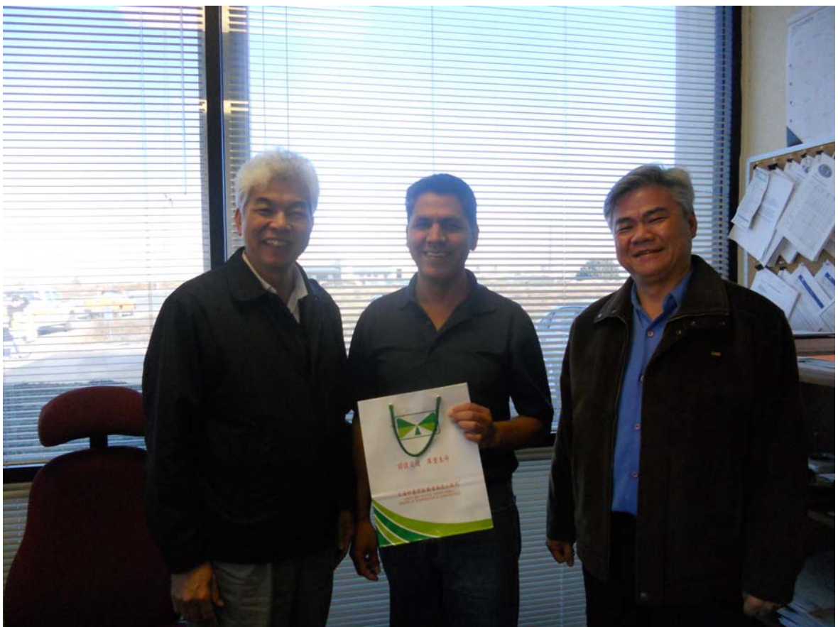
參訪 Antoich Bridge 專案工務所