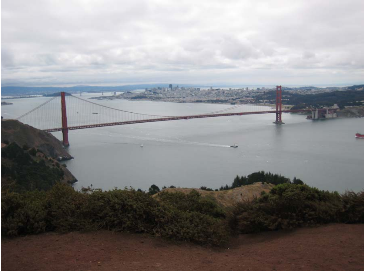
考察美國加州舊金山 Golden Gate Bridge