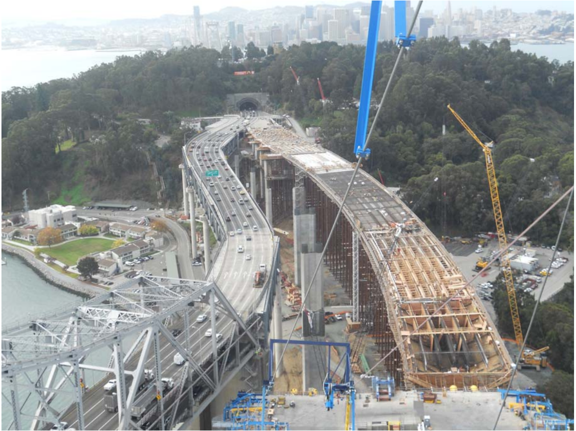
舊金山 New Bay Bridge 上部結構施工作業情形