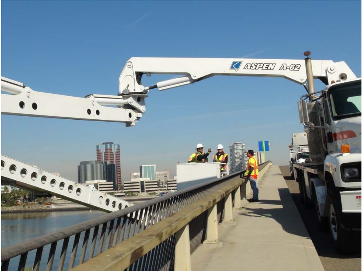
洛杉磯 Queens Way Bridge 橋梁檢測情形