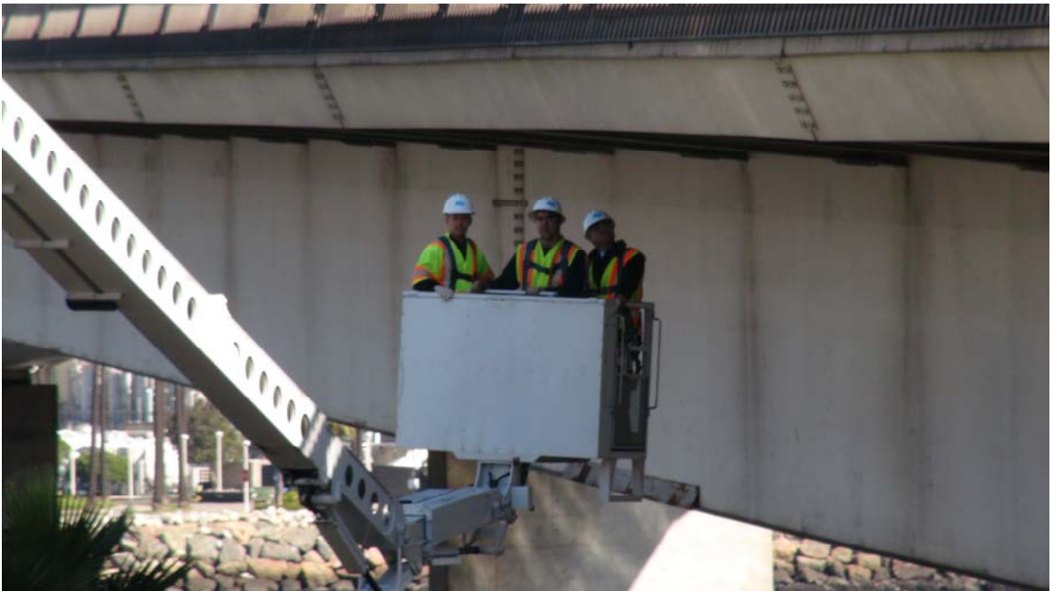
洛杉磯 Queens Way Bridge 橋梁檢測情形