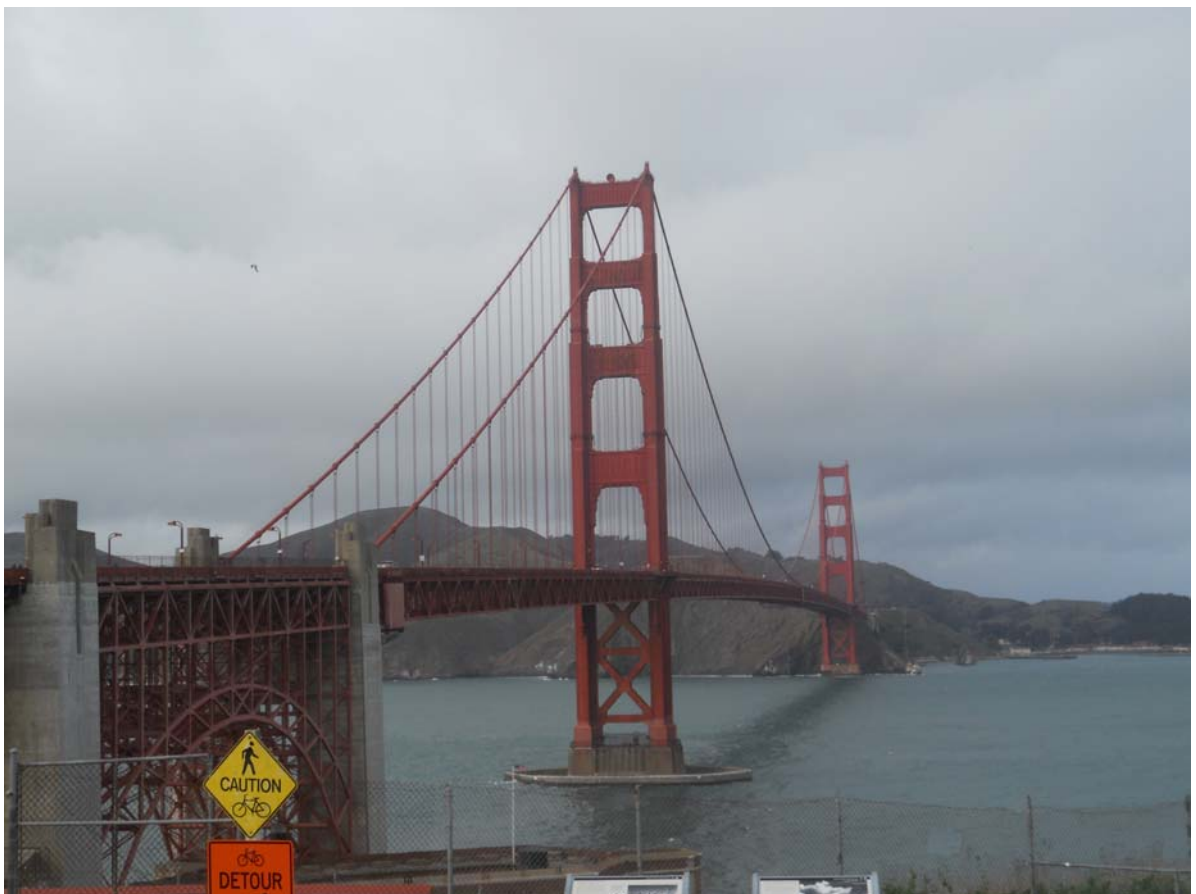
考察美國加州舊金山 Golden Gate Bridge