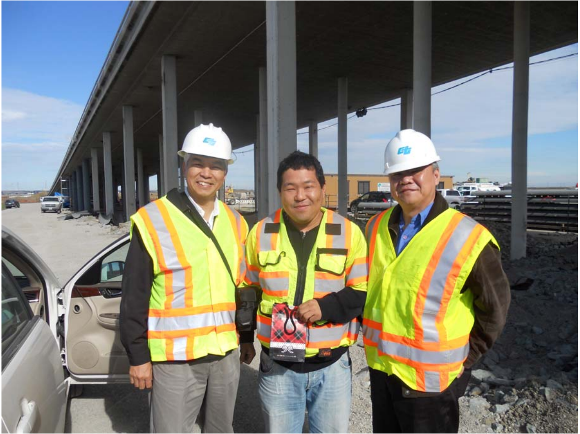
Antoich Bridge 橋柱耐震補強施工現場訪視情形