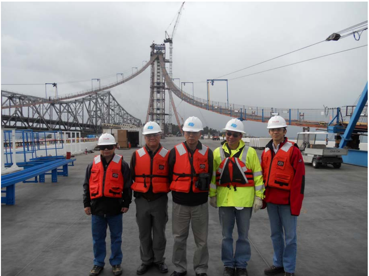
考察 New Bay Bridge 施工作業情形