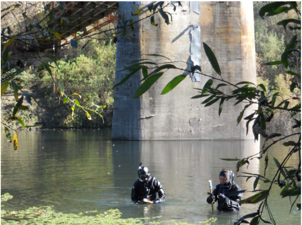
水下檢測小組於 Wohler Bridge 進行檢測作業情形