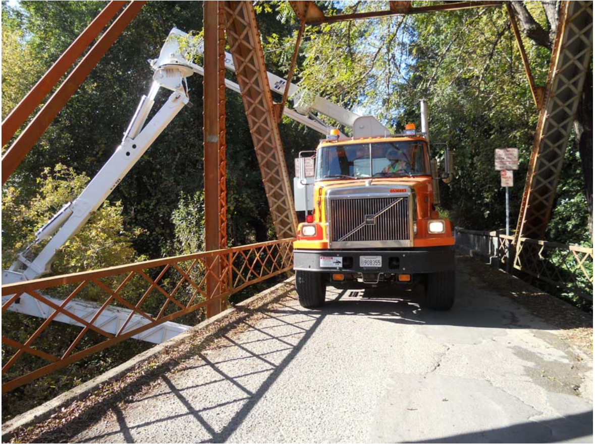
橋梁檢測車於 Wohler Bridge 作業情形