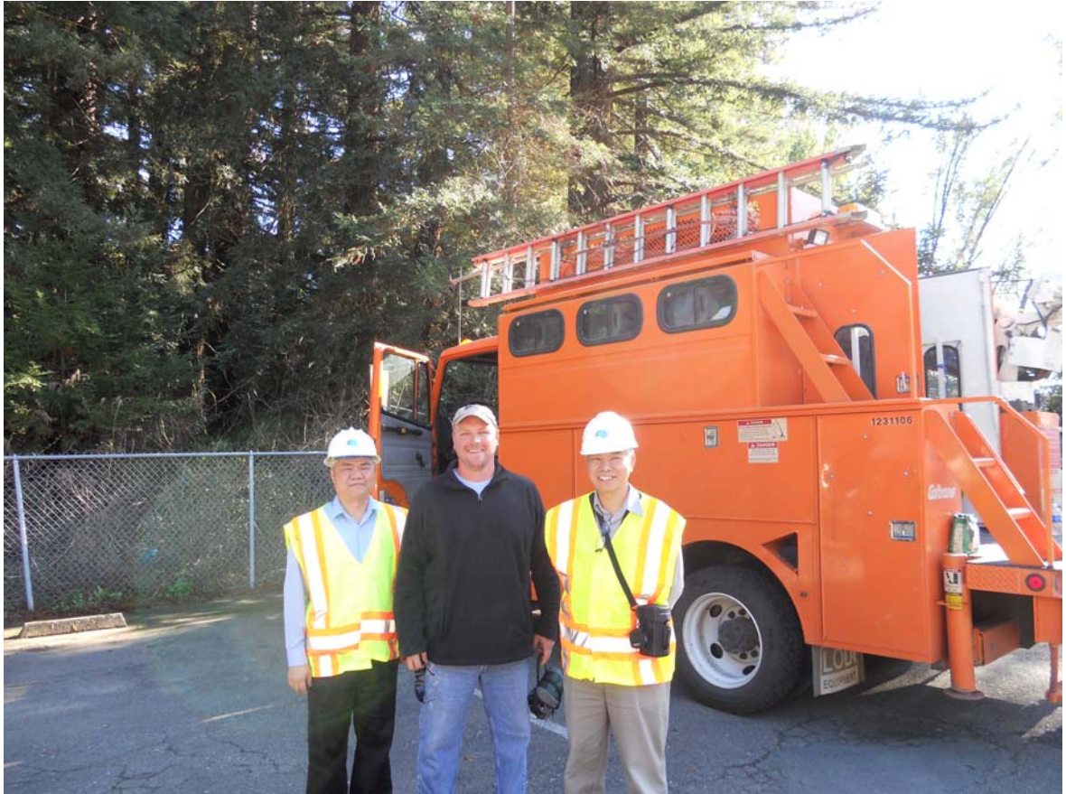
與水下檢測小組拍攝於 Wohler Bridge 進行檢測作業情形