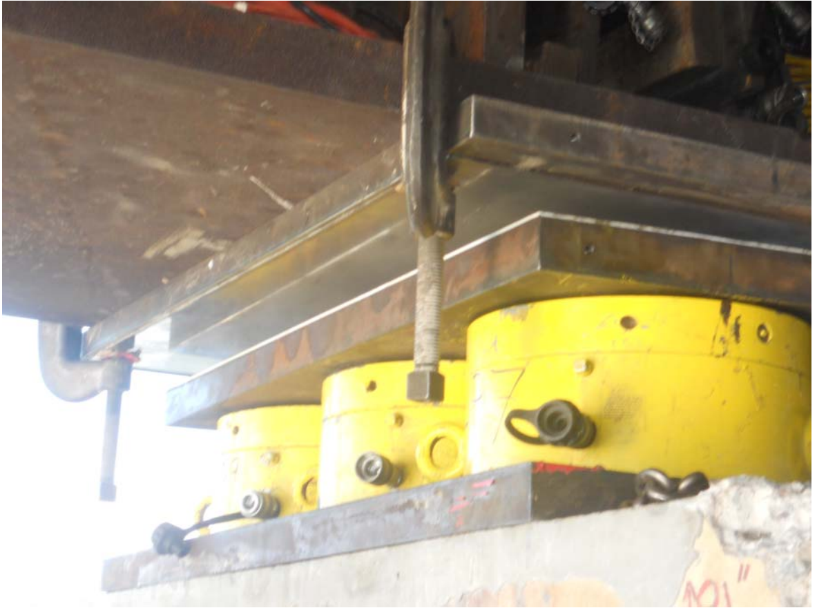
Antoich Bridge 橋梁支承墊更換施工情形